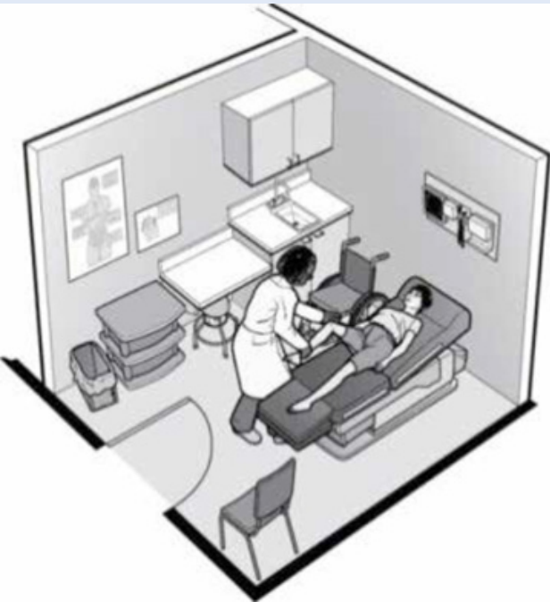
រូបភាព ១៖ គំរូនៅក្នុងបន្ទប់អ្នកជំងឺ